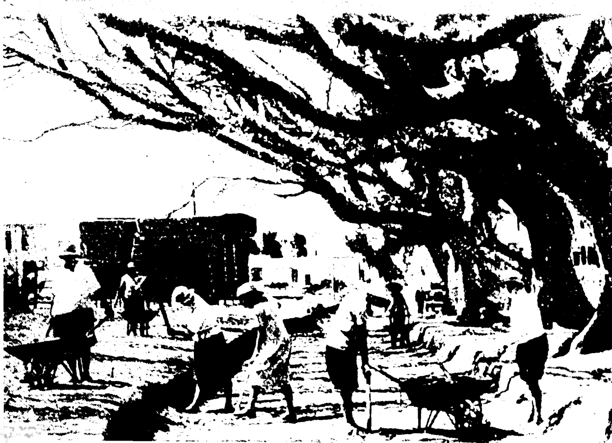
פועלות בסלילת רחוב הכרמל בתל-אביב, לצד עצי השקמים (כיום רחוב המלך גיורג), תרפ"ה

לקבוצות, היתה השגת עבודה תלויה בהצטרפות לקבוצת-עבודה, צעד שהיה כרוך, עבור הנשים בקשיים. וכך אנו קוראים: