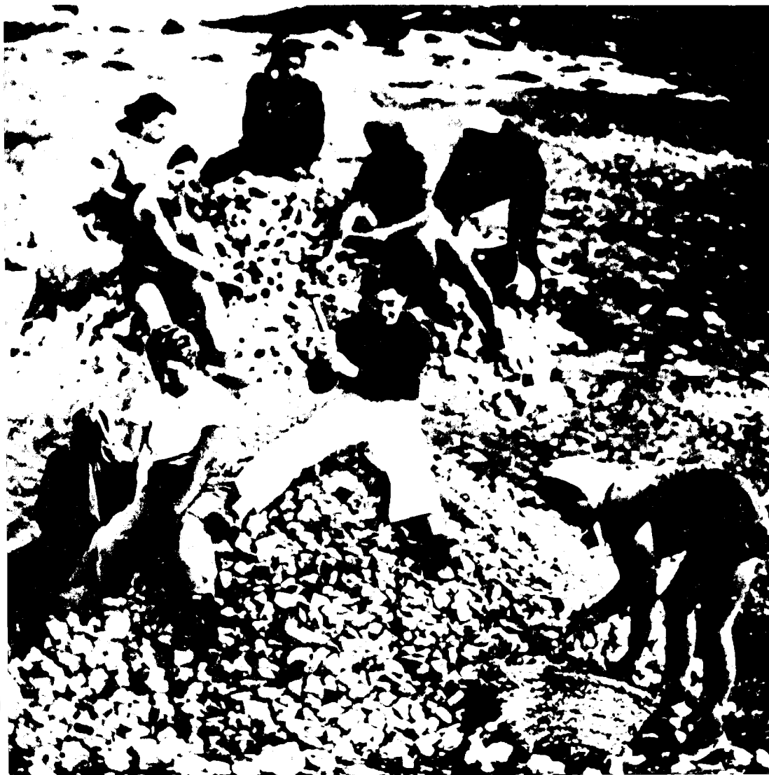
פועלות מכינות חצץ לכביש במעלה הריהכרמל, תרפ"ב

'אחדות העבודה' חששו מפני התארגנות נפרדת של העלייה השלישית. 86 גם אם לא נרמז שבוועידת 1920 ראו מנהיגי ההסתדרות את הנטיות הבדלניות של הנשים כסכנה לעצם קיומו של הארגון, הרי האיום של עדה פישמן-מימון, שהפועלות יגישו רשימה עצמאית לבחירות, הפך את קליטתן של מנהיגות הנשים לתוך המועצה לכדאית, במיוחד מאחר שהמאורעות מחוץ לתנועת העבודה חיזקו את תוקפו של האיום. המחלוקת בעניין זכות ההצבעה של הנשים באספת הנבחרים, שהתארגנה בזמן ההוא, הפכה את הפמיניזם לנושא חשוב ולבסיס לגיטימי להתבדלות ארגונית. בשנת 1920 כבר היתה קיימת בארץ-ישראל 'התאחדות הנשים