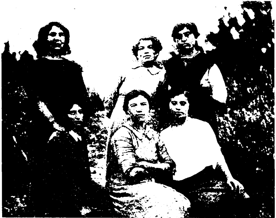
קבוצת הפועלות בחוות בן-שמון, תרע"ג

בקבוצות החקלאיות בשנים 1914-1918 — מהסתמכות מוחלטת על גידול דגנים בכיוון של גיוון רב יותר — הביא לפיתוח ענפים חדשים, וכך גם נתן הזדמנויות חדשות לנשים. ירידת מחיר הגרעינים והבצורת שפקדה את הארץ בשנת 1919, האיצו את התהליך במגמה של גיוון ושל אי-תלות. 53 הנשים הצטרפו לקולקטיבים שעסקו בפאלחה וגם הקימו מספר קבוצות עצמאיות לגידול ירקות, אשר מכרו בהצלחה את תוצרתן בשווקים. 54 גני-הירקות מוקמו בדרך-כלל ליד מטבחי-הפועלים הציבוריים, שבהם הועסקו הנשים כטבחיות. רוב התכניות קיבלו סיוע כספי צנוע מההסתדרות החקלאית וכן מקבוצות נשים ציוניות בחוץ-לארץ, בתיווכו של ועד הפועלות.