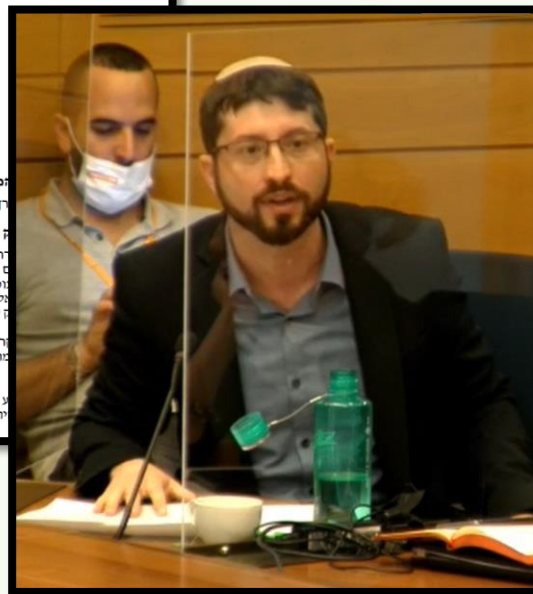
תזכיר חוק הגיור, לאחר הערות המרכז